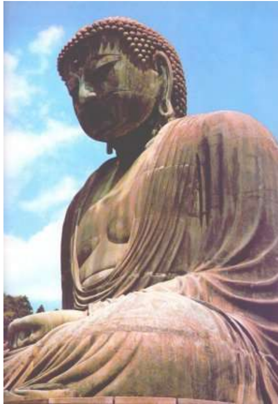
Estátua de Buda

Siddhartha então resolveu nunca mais voltar para sua cidade, passando a compartilhar daquele sofrimento, em busca de uma maneira de extingui-lo. Por muito tempo o jovem príncipe meditou e jejuou, mas depois de seis anos, abandonou tais práticas e passou a crer que a chave estava na ponderação: não era o sofrimento físico que trazia a purificação espiritual, mas sim o desapego das coisas mundanas. Tal descoberta o fez desenvolver sua forma de não sofrimento, que pode ser definido com a seguinte frase atribuída ao próprio Siddhartha : "Nada deve ser agarrado ou preso de qualquer forma".